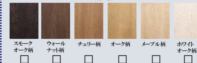
スモークオーク柄 ウォールナット柄 チェリー柄 オーク柄 メープル柄 ホワイトオーク柄 ダーク柄 ライト柄 エクセルホワイト柄