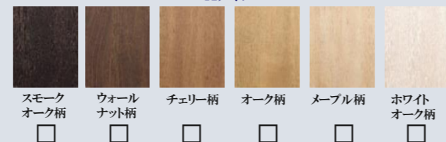
スモークオーク柄 ウォールナット柄 チェリー柄 オーク柄 メープル柄 ホワイトオーク柄 ダーク柄 ライト柄 エクセルホワイト柄