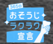
〔365日のおそうじラクラク宣言〕