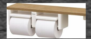
ホルダー色:ホワイト